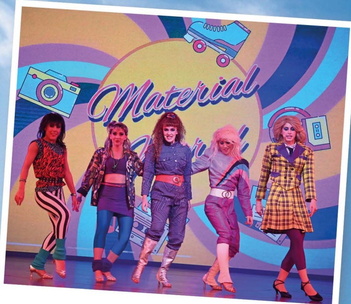
Mit den AIDA Stars zurück in die 80er