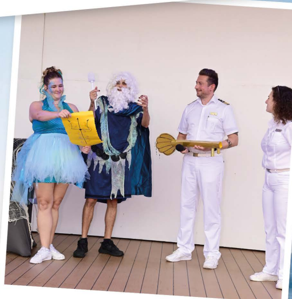
Äquatorsprung und Neptuntaufe