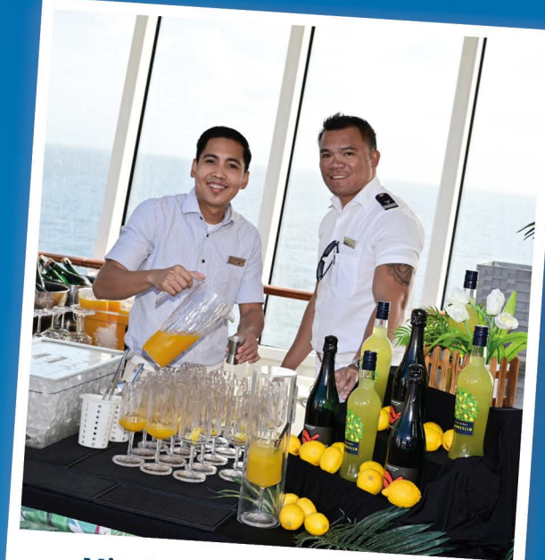
Mit einem Limoncello Sprizz die Sonne genießen