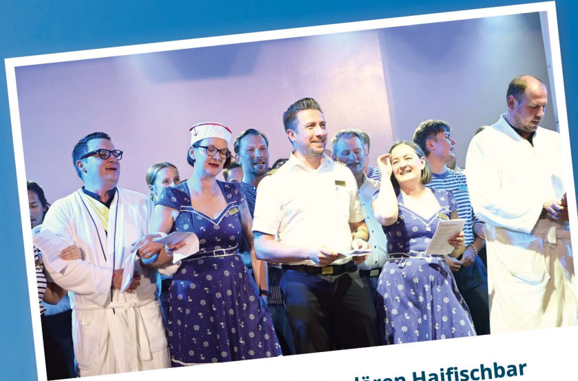
Schunkeln bei der legendären Haifischbar