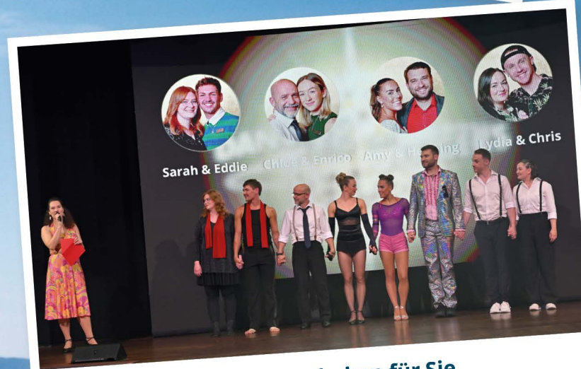
Ihre Offiziere haben für Sie das Tanzbein geschwungen