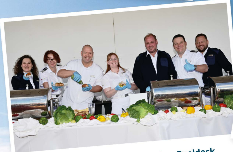
Kulinarische Highlights auf dem Pooldeck