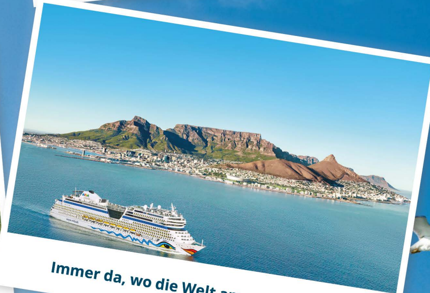
Immer da, wo die Welt am schönsten ist